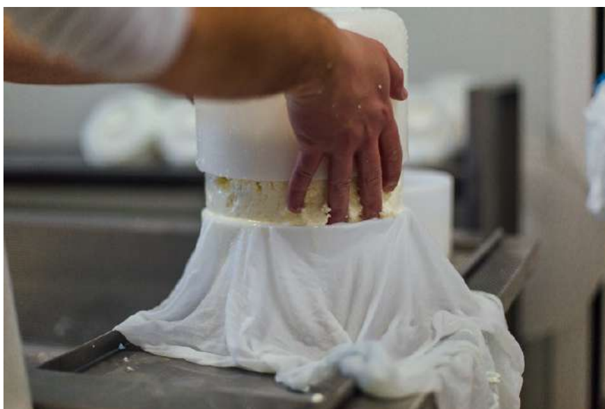
Llenado de los moldes

La segunda parte de este delicioso y nutritivo plan nos lleva a visitar una quesería artesana, familiar, que elabora unos quesos de gran calidad y de sabores muy característicos, gracias al origen de su leche de oveja y cabra, procedente de ganaderos locales a menos de 10 km de la quesería.