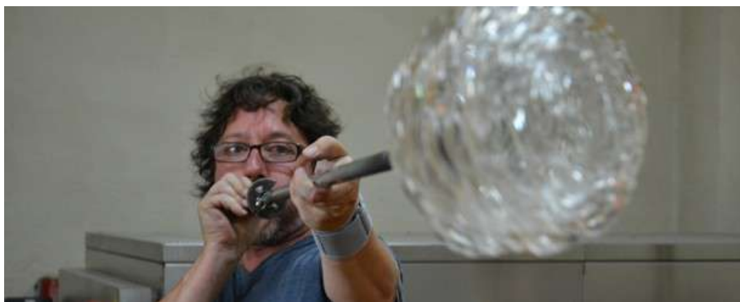
Experiencia vidrio soplado en Albacete

La experiencia consiste en unas demostraciones prácticas de diversos tipos de piezas con explicaciones didácticas y curiosas sobre esta técnica tan espectacular. Al final de la visita se obsequiará a cada asistente con una bonita pieza de vidrio soplado. Para formalizar la reserva pincha aquí .