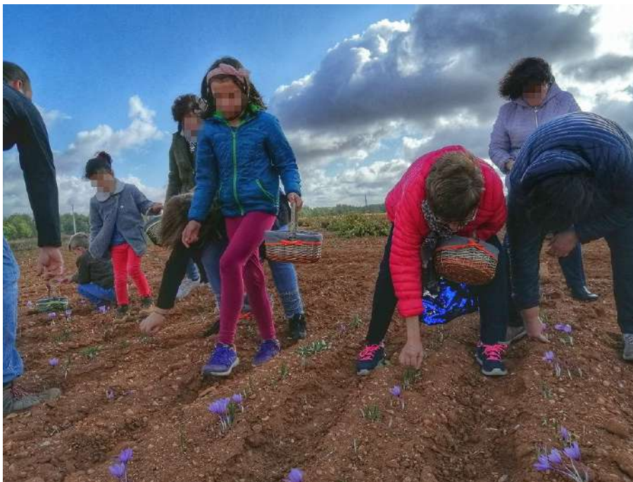
Campo de azafrán de La Mancha

Por la mañana vamos a tener la oportunidad de realizar una visita guiada a un campo de azafrán acompañados por un agricultor experto en este cultivo. Disfrutaréis de unas vistas espectaculares, las que nos ofrece el campo vestido por la rosa del azafrán. Con vuestras manos recogeréis las flores del campo. A los niños les encanta ir con su cestita y hacer una competición para ver quien recoge mayor número de flores.