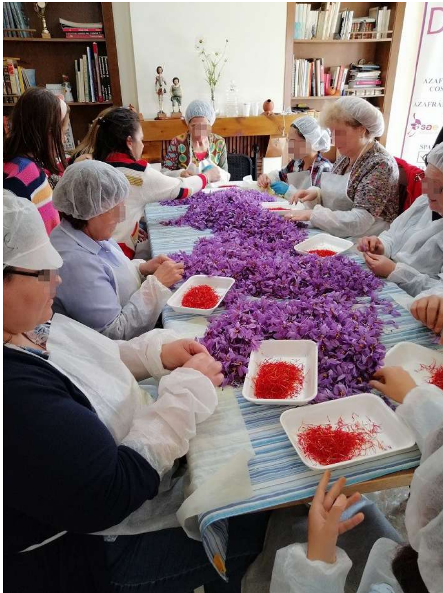
Monda de la rosa del azafrán

Para completar el viaje, os recomendamos una visita a la cercana población de Villarrobledo, cuyo conjunto urbano se articula en torno a la plaza Mayor, donde se levantan dos edificios significativos: el Ayuntamiento y la iglesia de San Blas.