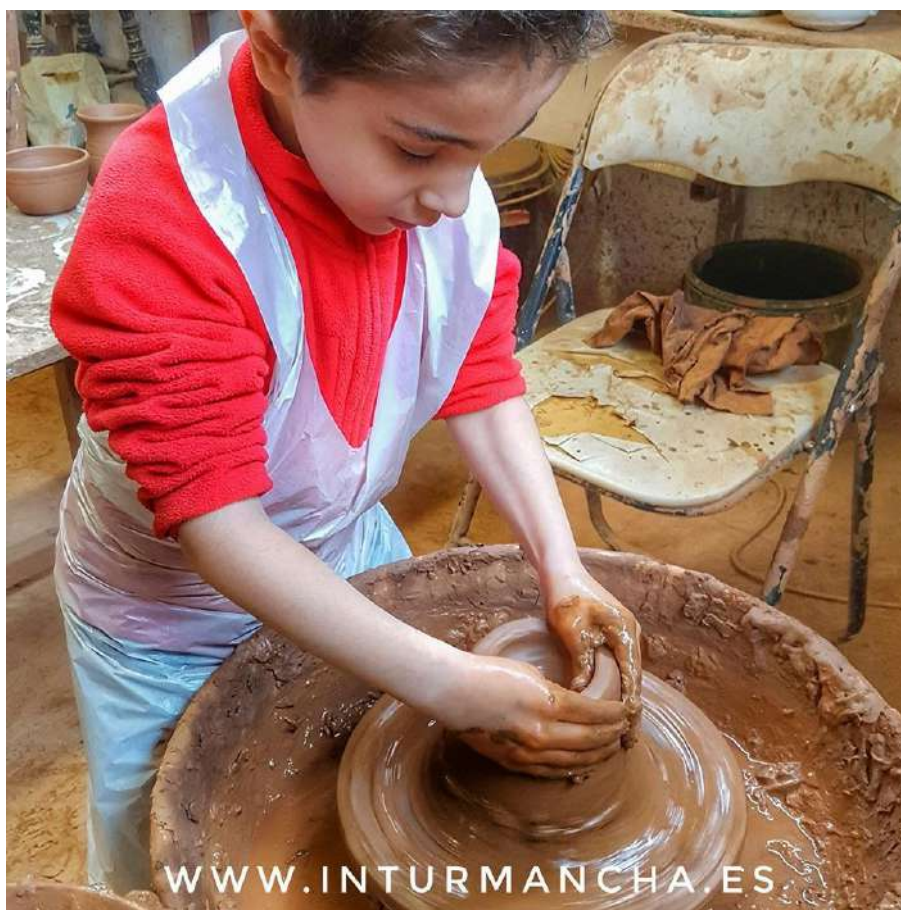
Modelando en el torno del alfarero

Como complemento para este viaje, recomendamos una escapada a la cercana población de Chinchilla de Montearagón. A escasos 13 km de Albacete, es uno de los pueblos más antiguos de la provincia, una joya medieval que se conserva prácticamente intacta. Destacar el castillo y la fortaleza, que dominan el paisaje desde el cerro de San Blas, proporcionándonos unas impresionantes vistas de la llanura manchega. Los niños podrán imaginarse que son caballeros e inventarse historias pasadas que sucedieron tras los muros del castillo.