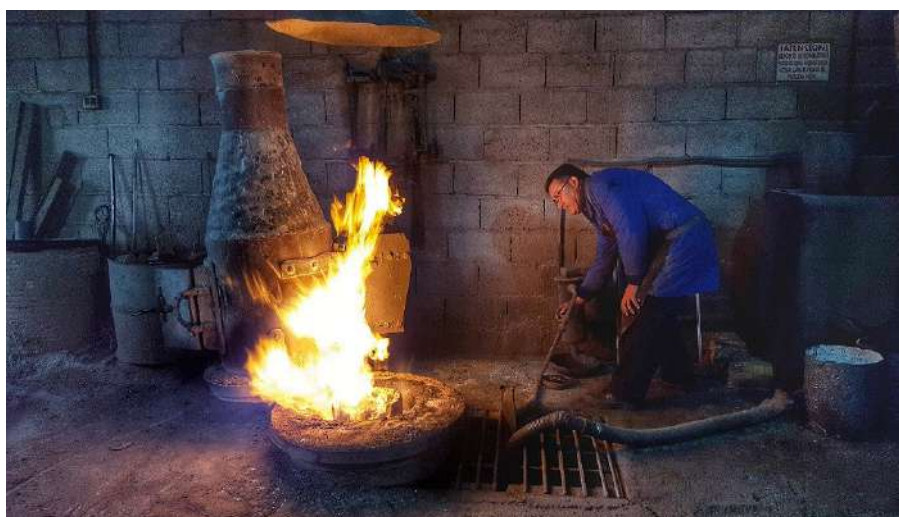
Visita guiada fundición artesanal en Riópar

Como broche final de la jornada, nos espera la visita guiada a una fundición artesanal de bronce, una experiencia única, curiosa e irrepetible.