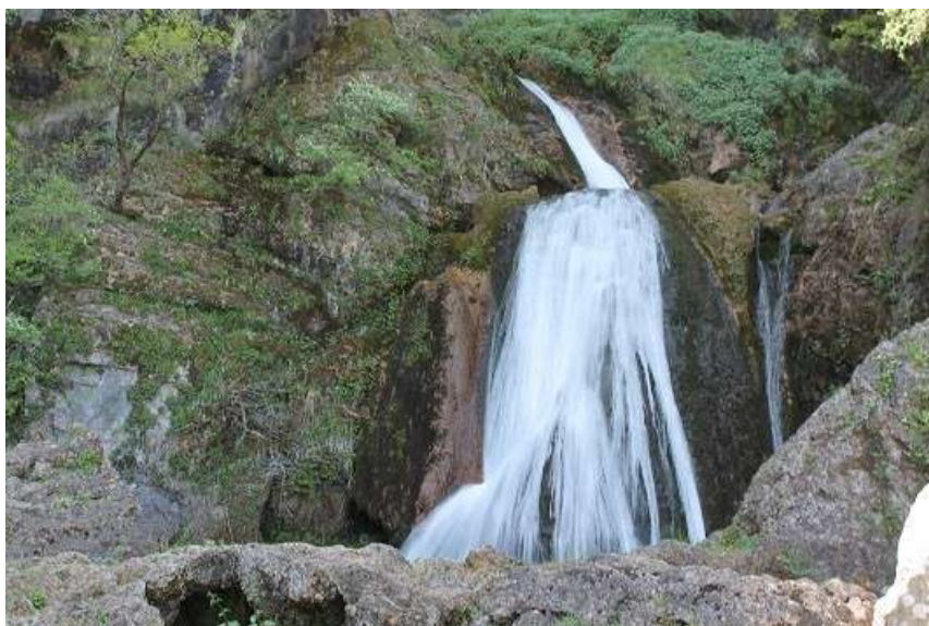
Nacimiento del río Mundo

Una parada obligada son aquellas Reales Fábricas de San Juan de Alcaraz que, tras su cierre en 1996 y posterior rehabilitación en 2001, muestran hoy en un museo sus más de dos siglos de historia mediante una importante colección de piezas de bronce y latón, moldes y maquinaria de los siglos XIX y XX.