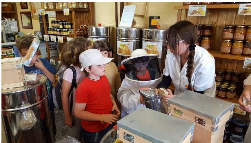
Visita guiada fábrica de miel

El refranero popular es sabio y con esta ruta alimentaria queremos hacerlo realidad. Proponemos a las familias con niños la visita guiada a una fábrica de miel para conocer in situ los diferentes procesos de fabricación y elaboración de la miel, así como otros derivados de la colmena. Nos vestiremos con el traje del apicultor, y degustaremos una auténtica miel natural.