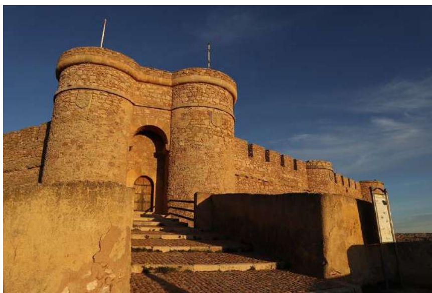
Murallas Castillo de Chinchilla de Montearagón

Como complemento para este viaje, recomendamos una escapada a la cercana población de Chinchilla de Montearagón. A escasos 13 km de Albacete, es uno de los pueblos más antiguos de la provincia, una joya medieval que se conserva prácticamente intacta. Destacar el castillo y la fortaleza, que dominan el paisaje desde el cerro de San Blas, proporcionándonos unas impresionantes vistas de la llanura manchega. Los niños podrán imaginarse que son caballeros e inventarse historias pasadas que sucedieron tras los muros del castillo.