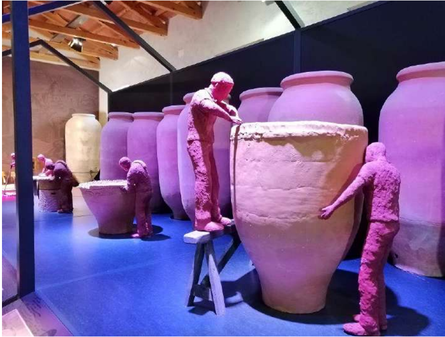
Centro interpretación de la alfarería tinajera de Villarrobledo

Villarrobledo es una de las ciudades que más superficie dedica a zonas verdes de uso público en toda España, con más de 140.000 m 2 de parques y jardines en su casco urbano, que serán un lugar ideal para que los niños disfruten de un rato de esparcimiento.